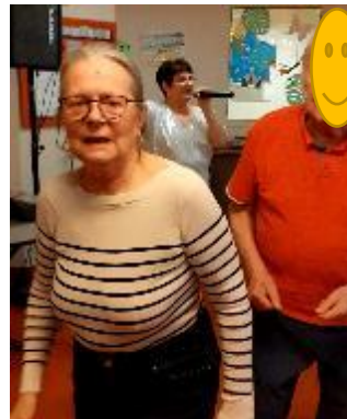
Oui, Mme C est debout et elle danse grâce au soignant