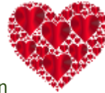
Des résidents préparent le printemps ou la St Valentin