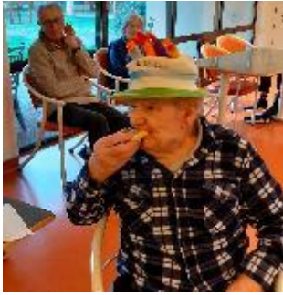
Le gateau des anniversaires est bon aussi.....