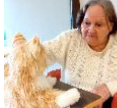
Mme C caresse le chat

Le temps des mots cachés, elle aime bien entendre ronronner le chaton qui est dans son panier