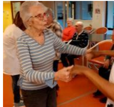
La bonne humeur et la joie sont au rendez-vous