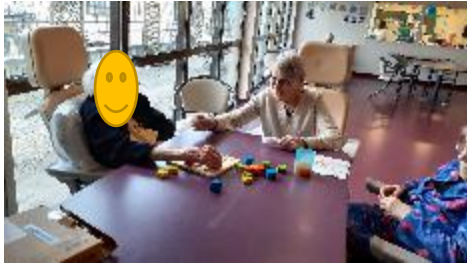
Jeux d'encastres réalisés à plusieurs