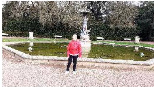
pour prendre l'air