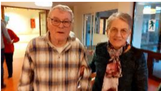
La joie d'être ensemble